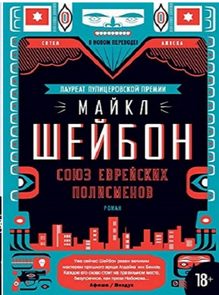
Майкл Шейбон и его «Союз еврейских полисменов»